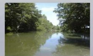
Copyright© Réalisation Communication Evènementiel. Tous droits réservés.

Au calme dans un site de verdure de 10 ha en propriété privée, les étangs du Giboin offrent plaisir et sérénité aux pêcheurs, grâce à ses deux plans d'eau de 3 et 6 ha ainsi que ses berges de Seine régulièrement entretenues et alevinées en poissons blancs et carnassiers par les soins d'une association de pêche.